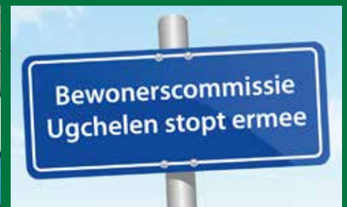
Bewonerscommissie Ugchelen stopt > pagina 4