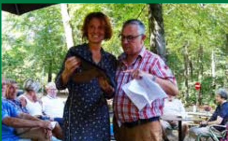
25 jaar De Sleutel > pagina 2

Neem contact op met De Sleutel: telefonisch: 055 5214510 of per mail: hbvstl@planet.nl