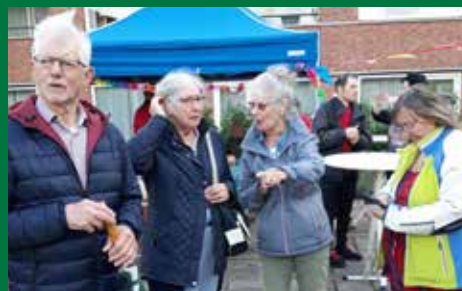
Burendag / De Vogelaars speeltuim > pagina 3